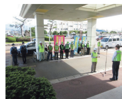
青パト出発式 (阿賀野市)