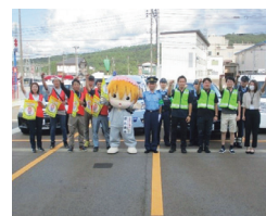
パトロール出発式 (妙高市)