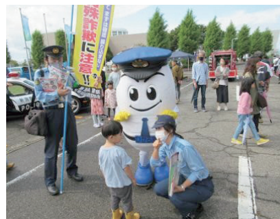
特殊詐欺被害防止広報 (新潟市南区)