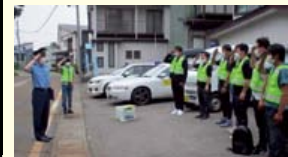
妙高青年会議所 青パト出発式(6月)