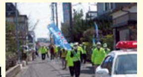
新潟市南区 日の出町防犯パレード(4月)