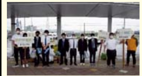
新潟北高校生徒による 大形駅防犯広報(5月)