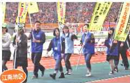
学生ボランティアによるサッカー会場での防犯広報 (大学生等学生ボランティア等)