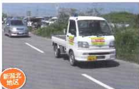
新潟東港セーフティネットワークの青パト活動 (青色パト防犯団体、自治体)