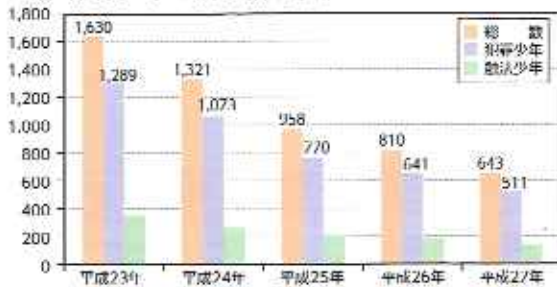
非行少年の検挙補導状況(県内の過去5年間) (人)

平成27年中の県内における非行少年の検挙補導人員は643人で、前年に比べ167人減少しています。