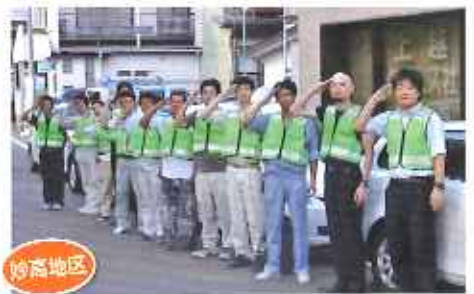
妙高青年会議所による安全まちづくり活動 (安全安心まちづくり関係功労団体として内閣総理大臣賞受賞)