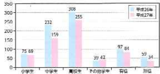
学職別検挙補導状況(前年比較) (人)