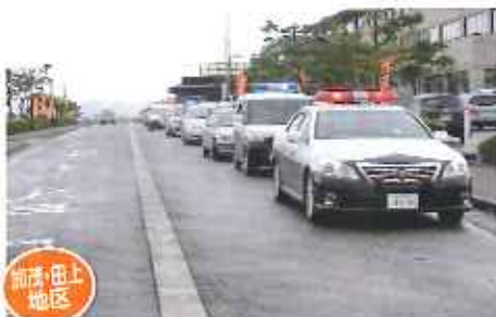
田上自治防犯パトロール隊出発式 (防犯パトロール隊員、自治体、警察等)

各地区防犯協会では、自治体・警察及び防犯ボランティア等と連携し防犯活動など安全安心まちづくりのための取り組みを行っております。社会に貢献されている防犯ボランティアの方々の活動を一部ご紹介します。