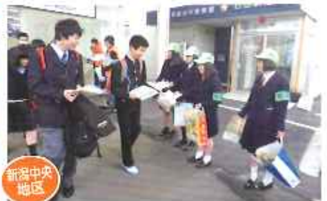
学生ボランティア等による犯罪防止広報 (高校生、小売酒販組合、防犯組合等)