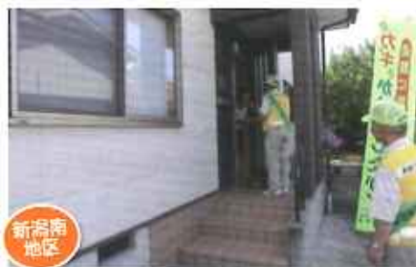
日の出町防犯パトロール隊のカギ掛け指導 (防犯パトロール隊員、防犯組合等)